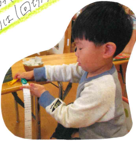
自分でアイソップで紙をしまいで 準備しています。